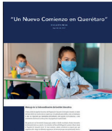
Primera Gaceta de Educación Inicial Agosto 2021

El primero es que hace un año, en agosto de 2021 lanzamos nuestra primera gaceta de Educación Inicial "Un Nuevo Comienzo en Querétaro" y nos sentimos muy contentos y agradecidos por todos los comentarios de los Agentes Educativos y Padres de familia que hemos recibido, sobre lo útil que les ha resultado los temas que se han abordado, así, que con el mismo amor y dedicación vamos por más años acompañando a las familias Queretanas en los procesos de desarrollo de los bebés, niñas y niños.