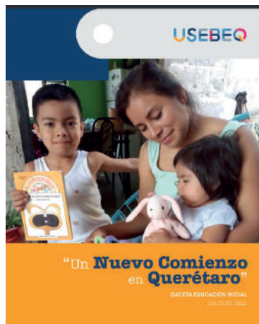
Gaceta No. 12 de Educación Inicial julio 2022

El segundo es que debido a la pandemia que vivimos en todo el mundo donde nos vimos obligados a trabajar desde lo virtual durante dos años, estamos muy felices de iniciar el nuevo ciclo escolar 2022-2023 de forma presencial, recibiendo a los bebés, niñas y niños pequeños con los brazos abiertos en nuestros CAI, así como también continuar acompañando a las familias con el programa de Visita a los Hogares, con todo el amor y la calidez de nuestros Agentes Educativos.