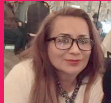
ELABORADO POR: LIC. JULIETA SALCEDO SÁNCHEZ

Siempre he sido una gran emprendedora y me gustan los retos, ir más allá del protocolo, de tal manera que en preescolar yo daba clases de inglés con mis niños y toda la mañana era bilingüe; hacíamos actividades de cocina en maternal y con los lactantes desarrollaba constantes evaluaciones, actividades neuromotoras y lingüísticas para favorecer su desarrollo.