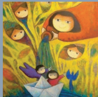
ELABORADO POR: LIC. DÉBORA MARÍA CARBAJAL DUMESNI

Se continuó dando acompañamiento a los padres y alumno para cubrir las necesidades del niño que aseguraran la parte emocional estable para favorecer su desarrollo integral.