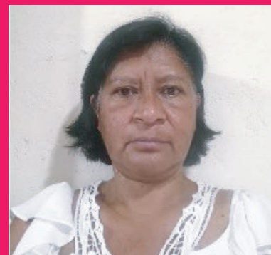
ELABORADO POR: LIC. JULIETA SALCEDO SÁNCHEZ

Para mí es una gran satisfacción laboral en el CAI, tener la oportunidad de conocer a los niños desde que son bebés, ver de cerca su crecimiento y los avances que van teniendo, estamos para ellos en todo momento y seguiremos atendiéndolos con el gusto y cariño característico de este nivel, ya que es su primera infancia y los estamos preparando para la vida, los niños son como un tesoro que debemos cuidar y proteger.