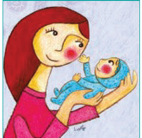
ILUSTRACIÓN DE RIMA KOUSSA

Complementando todo lo anterior es importante explicar (o interpretar) a los bebés, niñas y niños las experiencias internas y externas que están viviendo y que forman parte de un todo al interior de cada una o uno, éstas se reúnen para la formación de su personalidad y que con cuidados de calidad se asegura su salud psíquica presente y futura.