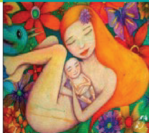
ILUSTRACIÓN DE ANALÍA HEREDIA

ELABORADO POR: MA. DEL CARMEN ESCOBEDO RICO