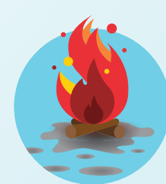
Ceniza de madera