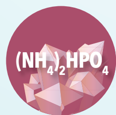
Fosfato de amonio